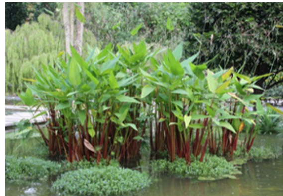
Gambar 1. Tanaman Kana Air ( Thalia geniculata )

Proses pengolahan air limbah dilanjutkan dengan proses didalam constructed wetland berupa lahan peralihan antara bagian daratan dan perairan di mana sebagian besar formasinya adalah air. Sistem constructed wetland biasanya memanfaatkan beragam tanaman yang berhabitat pada lingkungan akuatik (Stefanakis, 2019).